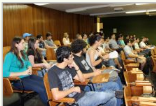
Estudantes participam da reunião realizada no Câmpus Goiânia

Dezenas de alunos de cursos de graduação do Instituto Federal de Goiás (IFG), que foram selecionados para participar do Programa Ciência sem Fronteiras, reuniram-se hoje, 28, para receber orientações sobre a viagem. A maioria vai viajar para um país estrangeiro pela primeira vez e com a missão de aprimorar conhecimentos na sua área de formação, permanecendo um ano e meio numa instituição de ensino superior do país